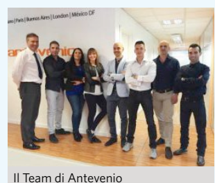
Il Team di Antevenio

drid, Barcellona, Milano, Parigi, Buenos Aires e Messico D.F. Particolarmente soddisfacenti sono state le performance delle filiali in Sudamerica e Francia. Messico e Argentina assieme hanno raggiunto un fatturato di quasi 3 milioni di euro, la Francia di 3,3 milioni di euro. Anche la Spagna è tornata a crescere e ha raggiunto un fatturato di 10 milioni di euro con una crescita del 6,5% rispetto al 2014. Per quanto riguarda le aree di business caratteristiche, l'area publishing (Turista curioso, Cliccalavoro, Inviputus) si è consolidata come motore trainante dell'azienda, generando un fatturato di 12,2 milioni di euro. L'area